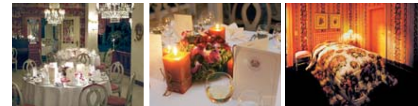
Die Orangerie (links und Mitte) zeigt sich im französischen Landhausstil. Die eleganten Schlafzimmer (rechts) bieten eine entspannte Atmosphäre.