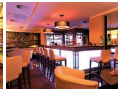
Das Gourmet-Restaurant „La Terrasse“ Die Smoker's Bar „La Fumadora“