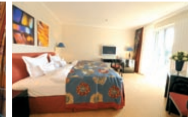
Farbbekennnis: Unsere renovierten Suiten und Zimmer in neuem Look

Seit 1956 ist das Park Hotel Bremen Treffpunkt für nationale und internationale Prominenz und ein Zuhause auf Zeit für Geschäftsleute und Privatreisende. Ein Hotel, das Luxus und Komfort auf höchstem Niveau bietet, braucht ständige Erneuerung. Die Herausforderung dabei: das besondere Flair und den individuellen Charme unseres Grandhotels zu bewahren.