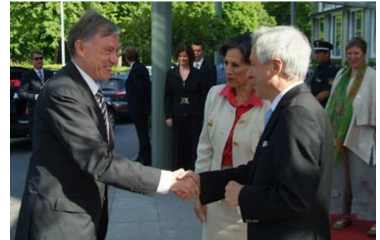
Hoher Besuch: Anlässlich des Chortreffens 2008 besuchte Bundespräsident Horst Köhler das Park Hotel Bremen

An den vier Sonntagen vor Weihnachten laden wir wieder zu unserem beliebten Adventsbrunch ein. Großes Theater wird an Heiligabend geboten. In der Kuppelhalle überraschen wir Sie mit einem festlichen 4-Gänge-Menü und einer echten Urauffüh-